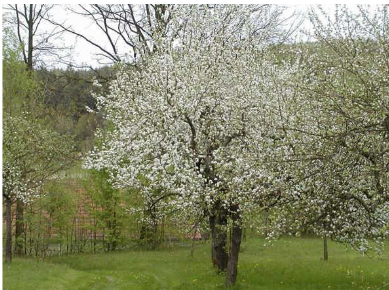
3. Jabloň na jaře

Anička horlivě přikývla. Tehdy pobíhala od jednoho stromku ke druhému a ke každému květu čichala, jak krásně voní.