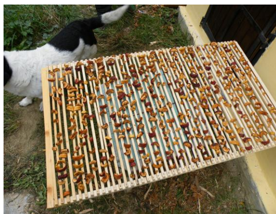
16. Líska s jablky

„V zimě z nich budeme mít křížaly,“ řekla maminka.